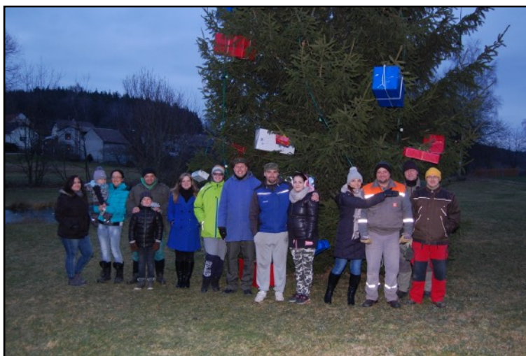
Advent 2017 - společné zdobení vánočního stromu v Tlucné

10. únor 2018 Beseda o myslivosti společenský dům v Tlucné od 14,00